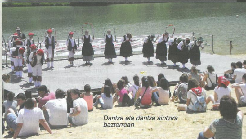
Dantza eta dantza aintzira bazterrean