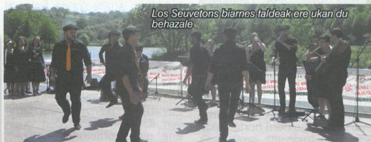
Los Seuvetons biarnes taldeak ere ukan du behazale

Bilkura argia zinez, besta guzieren idurikoa... J-B D