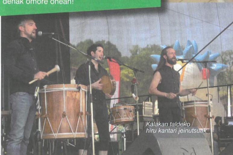
Kalakan taldeko hiru kantari jeinutsuak