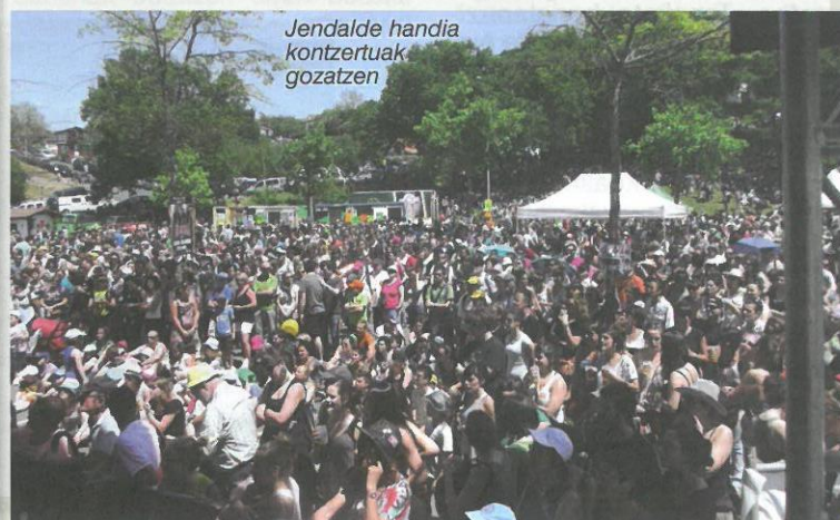
Jendalde handia kontzertuak gozaten