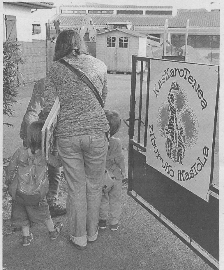
Kaskaroteneak gaur egun duen egoitzako sartzea. SYLVAIN SENCRISTO

Gune berrian abiatu beharko dute haurrek irailtik lekora, ikastola orain den tokia uzterat behartuak baitira. «Horregatik nahi dugu eraikitze baimen gal- dea ahal bezain fite pausatu, epe bat baita ondotik auzoendako, ados direnez errateko». Baimen galdea herriko etxeak onartu on- doan, bi hilabeteko epea luke ho-